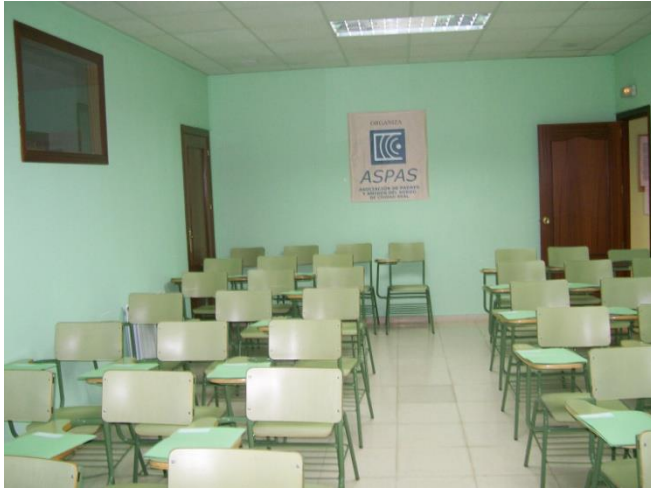
Foto 7.- Sala de Usos Múltiples.