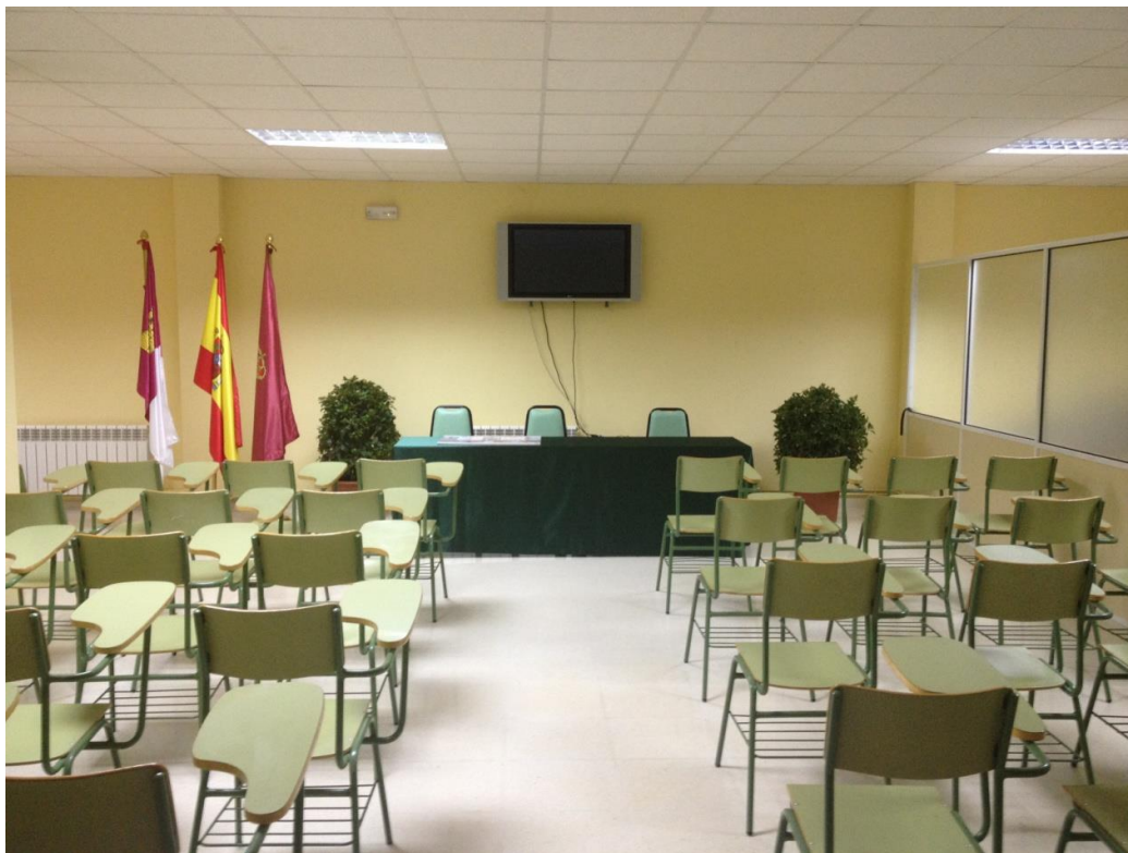
Foto 8.- Salón de Actos.