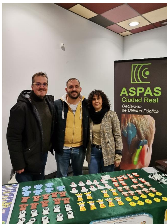
Mercadillo Solidario (2022)