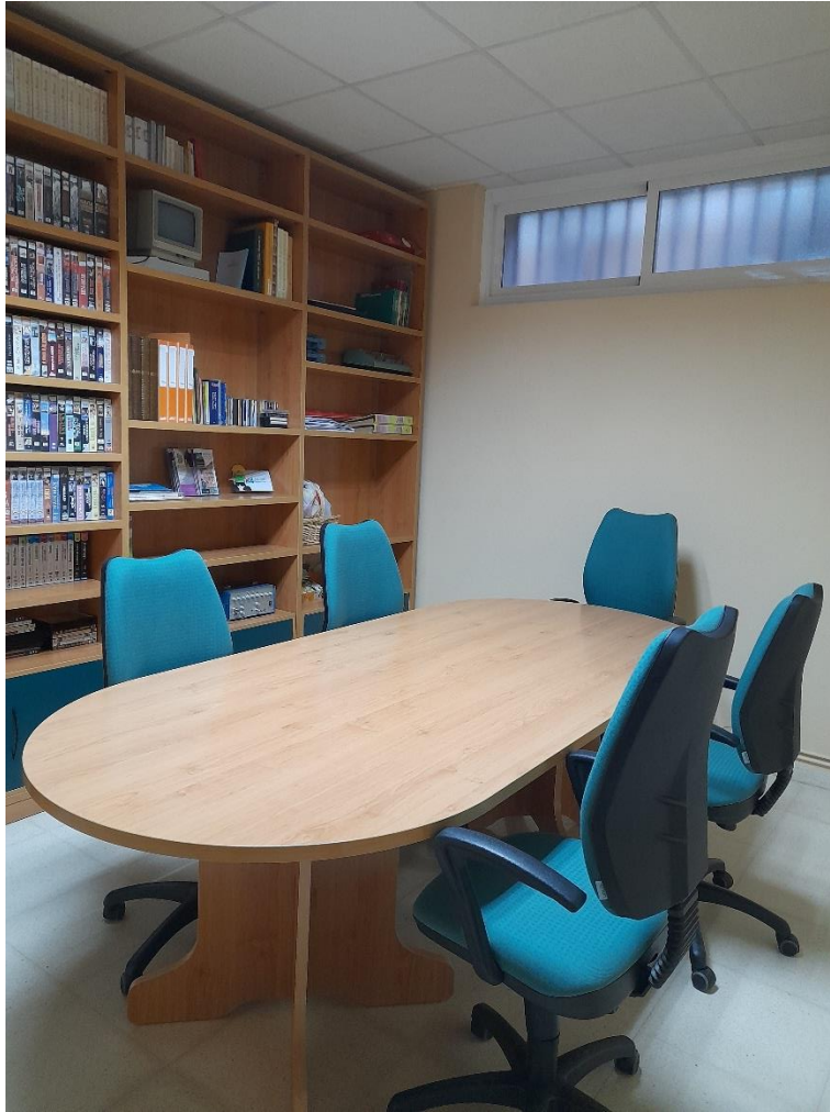
Foto 6.- Sala de Reuniones.