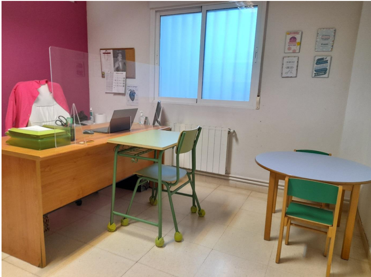
Foto 2.- Gabinete de Psicología.