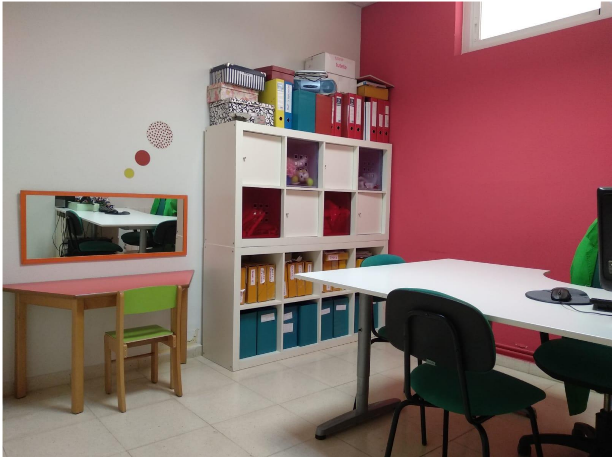
Foto 5.- Gabinete de Logopedia 3.