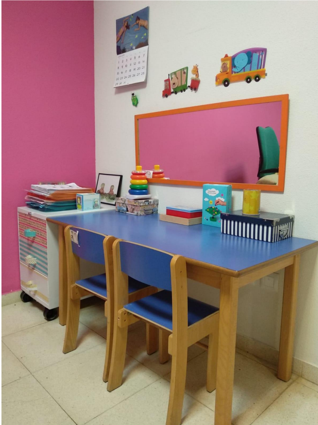
Foto 4.- Gabinete de Logopedia 2.