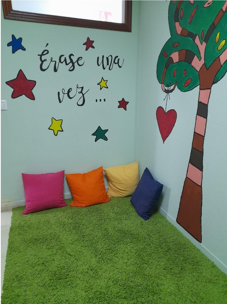
Foto 9. Biblioteca