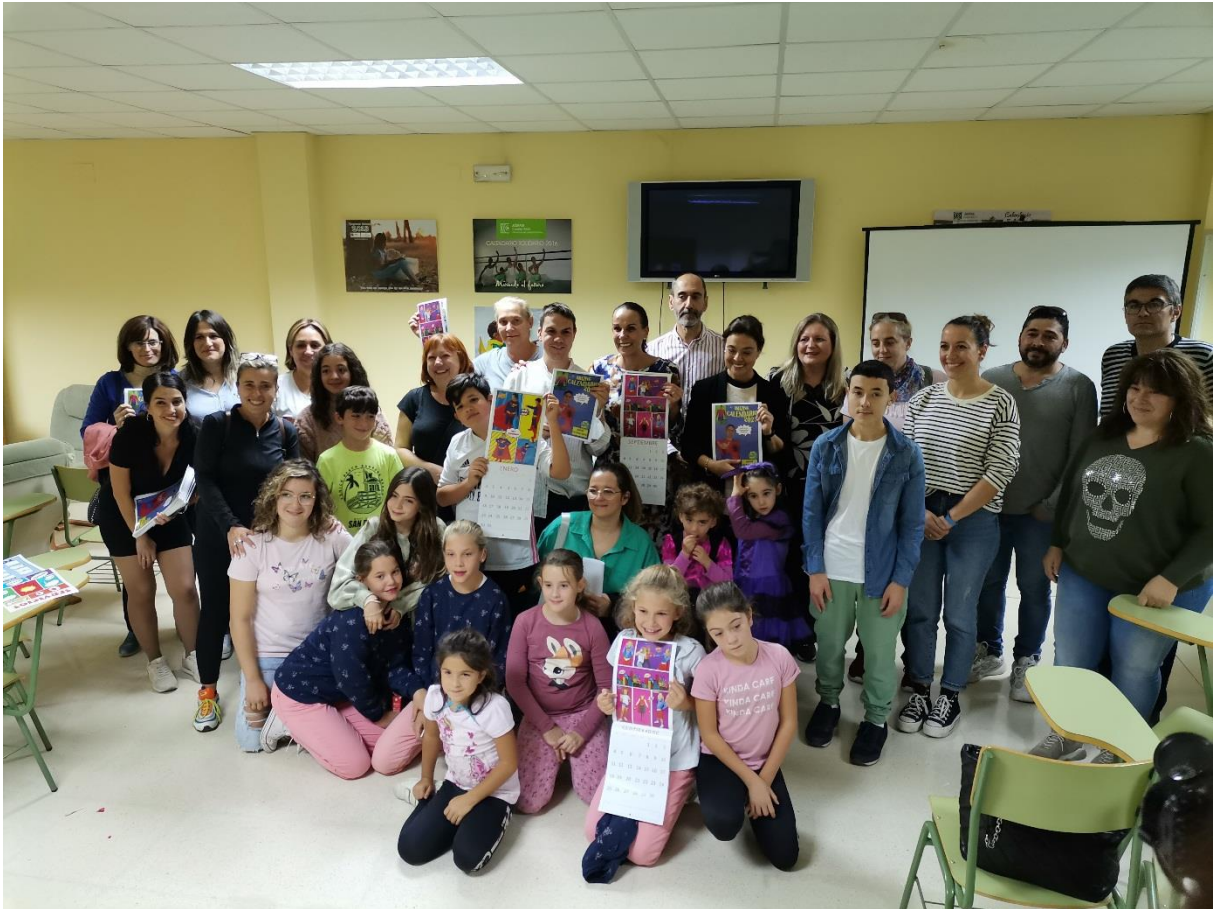
Presentación del Calendario Solidario de ASPAS Ciudad Real 2022