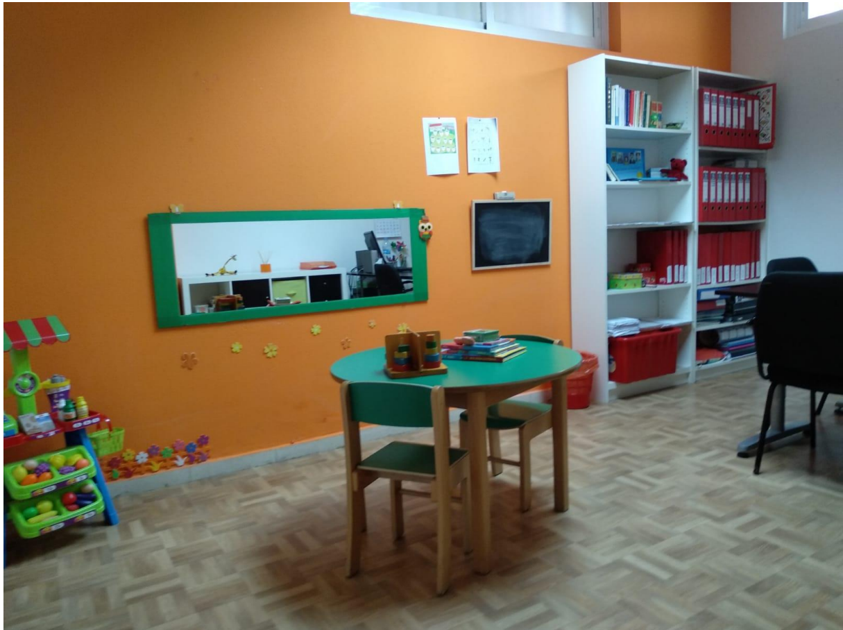
Foto 3.- Gabinete de Logopedia 1.