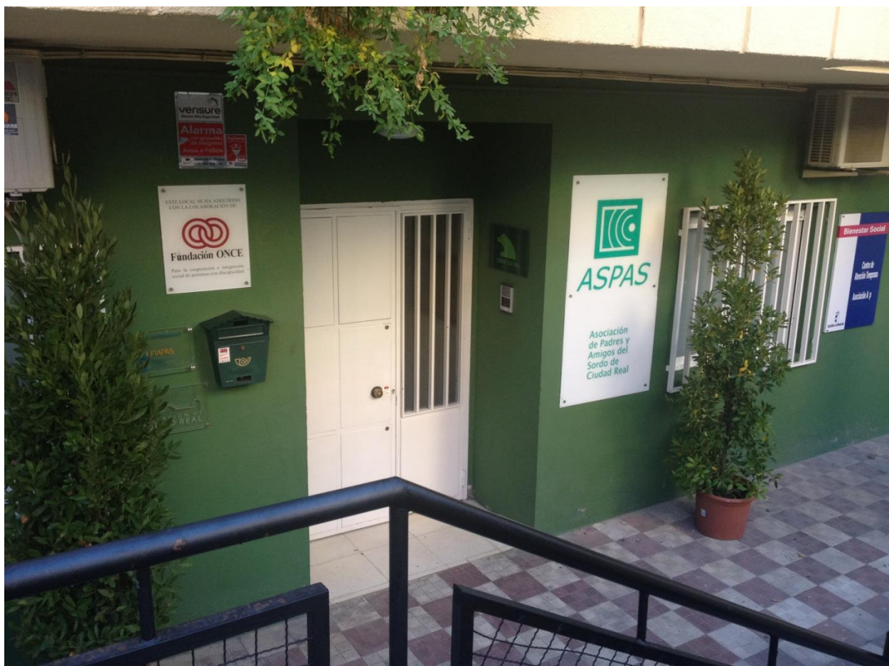
Foto 1. Puerta de acceso de la sede social de ASPAS Ciudad Real.

ASPAS Ciudad Real tiene su sede social en Residencial Ronda, Bloque 6, (Local). de Ciudad Real.